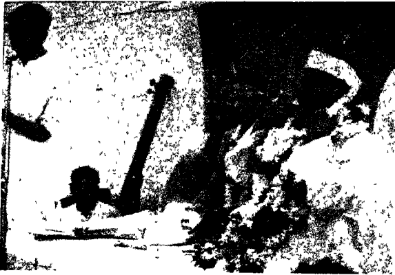
स्नेह-स्वागत की पुष्प-वर्षा